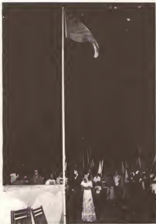
Anualmente, dia 18 di Maart, ta worde celebra aki na Aruba, como dia cu nos himno y bandera a wordo inaugura oficialmente.